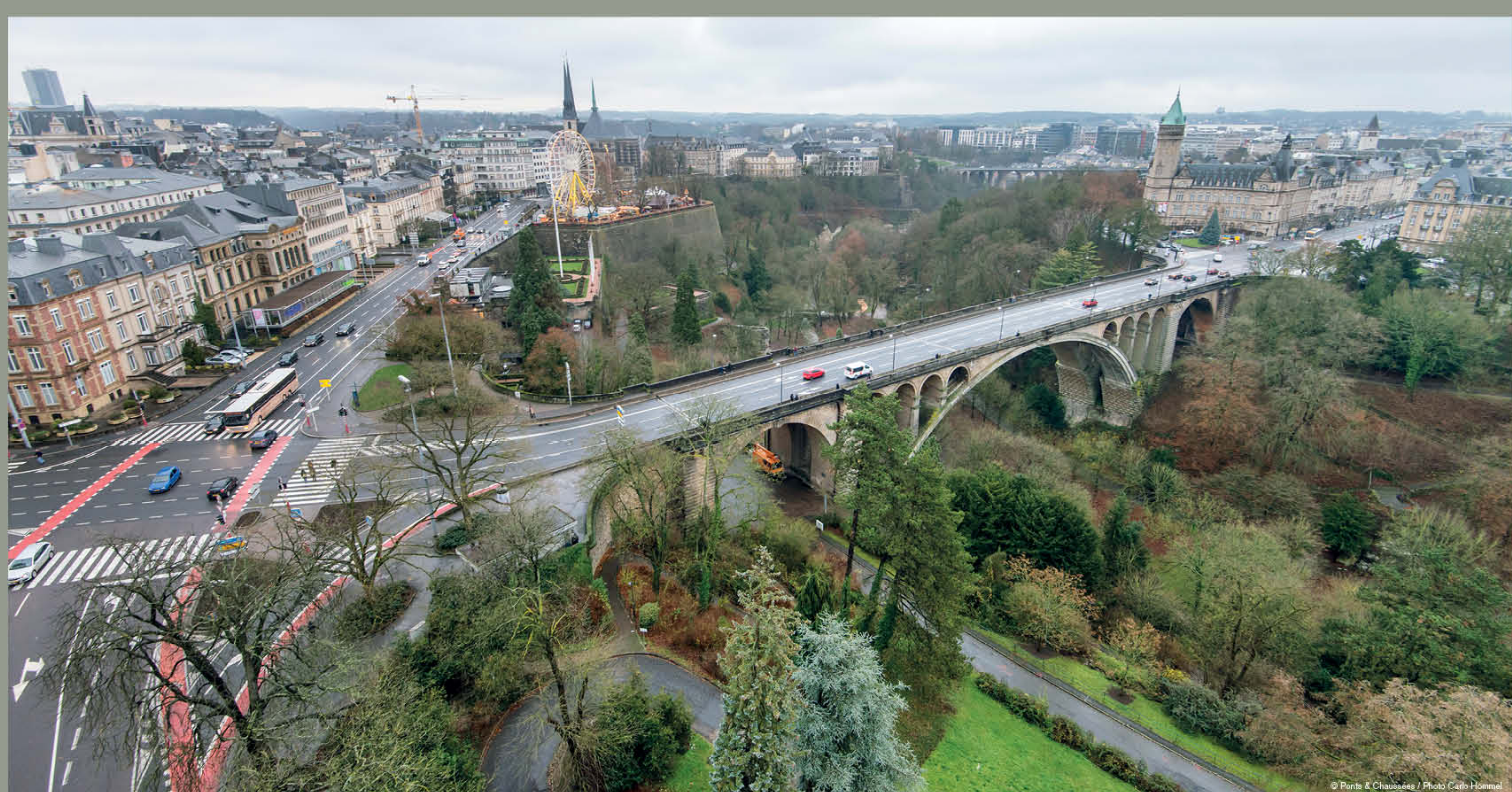
Figure emblématique de la Ville de Luxembourg, paysage favori des cartes postales et haut lieu de la Fête nationale luxembourgeoise, le pont Adolphe, baptisé ainsi en hommage au Grand-Duc Adolphe qui régna sur le pays de 1890 à 1917, enjambe la vallée de la Pétrusse depuis 1903.

Assurant la liaison entre la Ville-Haute et le plateau Bourbon, sa vocation première était de satisfaire la communication et la mobilité entre ces deux quartiers de la capitale. Présentant quatre voies de circulation, une en direction de la Ville-Haute réservée aux transports en commun et trois réservées au trafic individuel en direction de la gare centrale, le pont compte de chaque côté un trottoir de 1,80 m de largeur, séparé des voies de circulation par un chasse-roue.