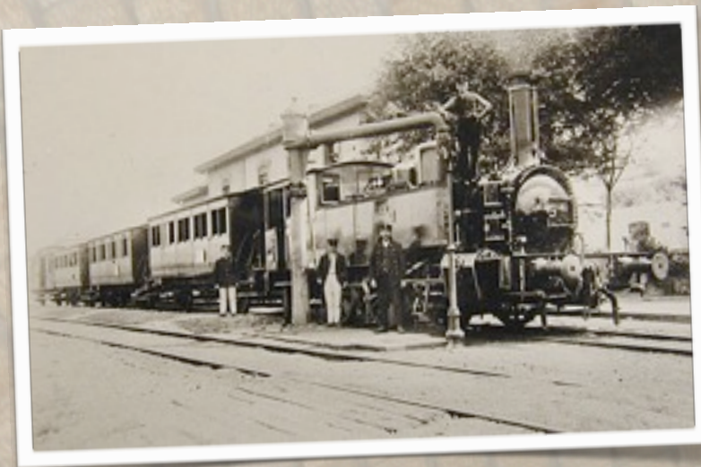
Locomotive PH 5 "La Maragole" à Eischen

Mais, les affaires de Philippart périclitèrent de sorte qu'en 1874, 89 kilomètres seulement sur les 230 prévus étaient terminés. En 1880 il y en eu 140, réalisés grâce à des injections massives et non prévues de fonds public.