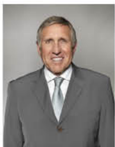
François Bausch Ministre du Développement durable et des Infrastructures

Je tiens à exprimer mes sincères remerciements envers tous ceux qui ont contribué à la conception et à la réalisation de ce projet réussi dans le plus grand respect de son caractère historique et écologique et je suis confiant que les nouvelles infrastructures se prêteront parfaitement aux besoins de leurs utilisateurs.